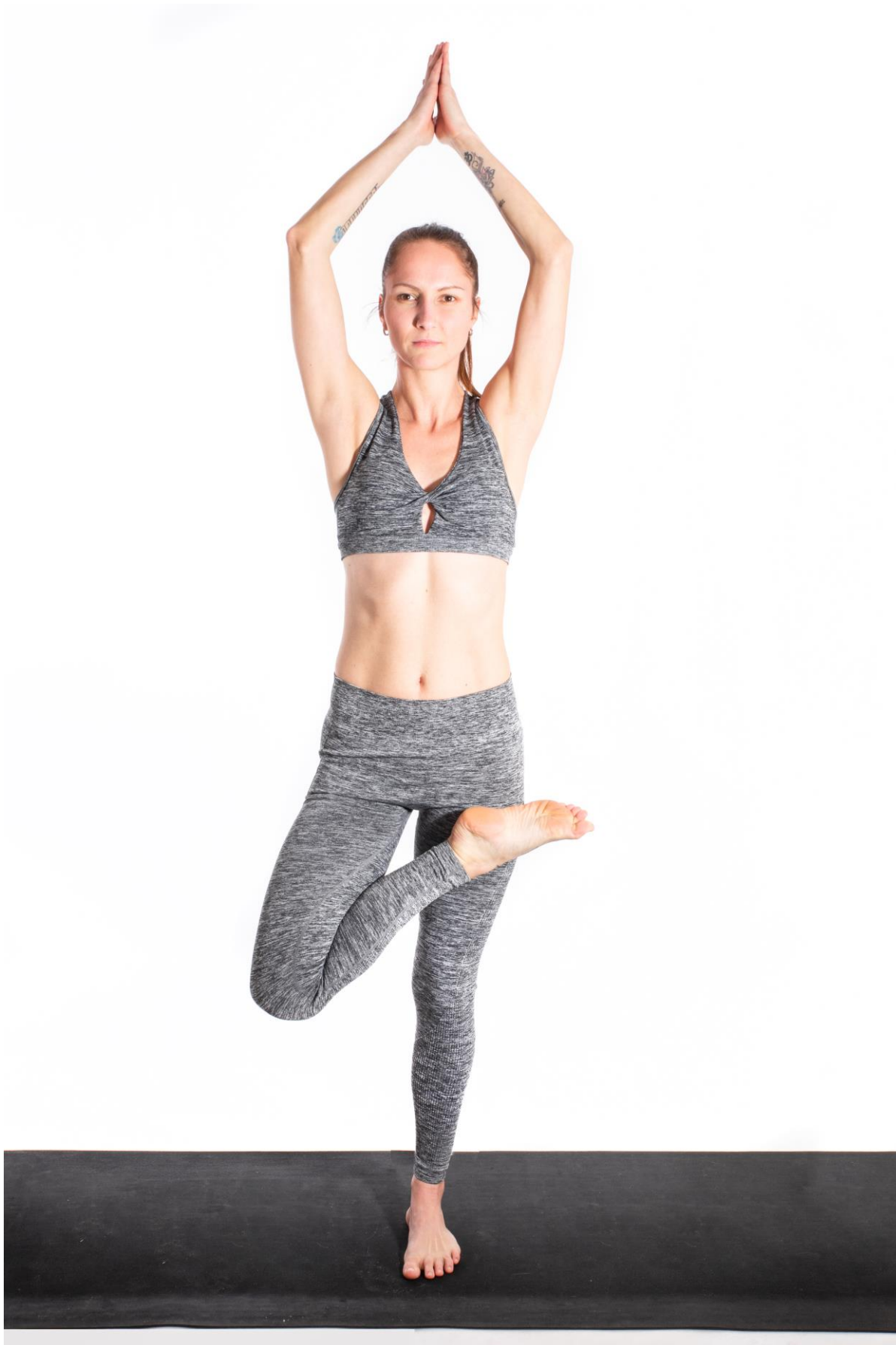
Další stojné pozice