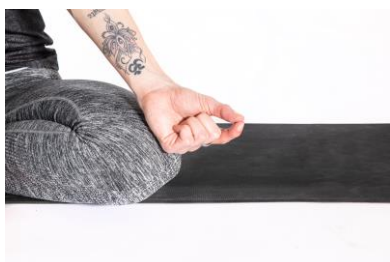
Činmaja – hrudní dech